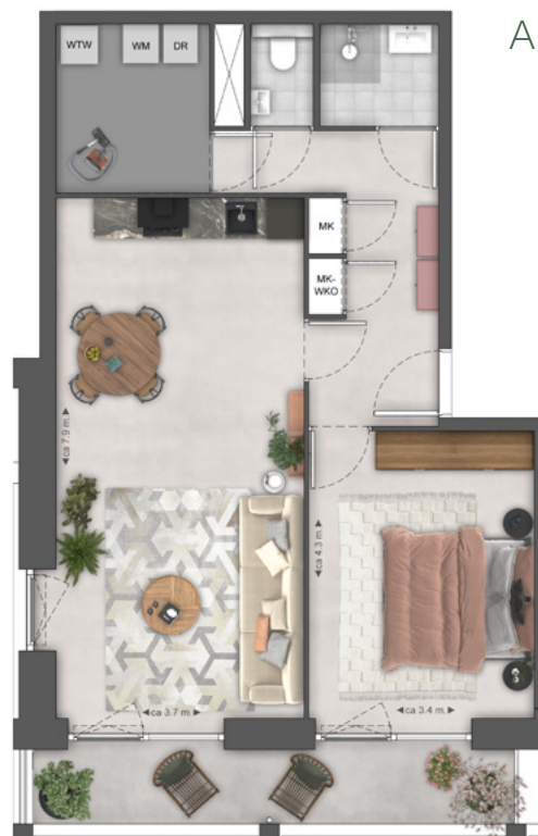
APPARTEMENT TYPE B4

Vanuit elk appartement heb je verrassend groen uitzicht.