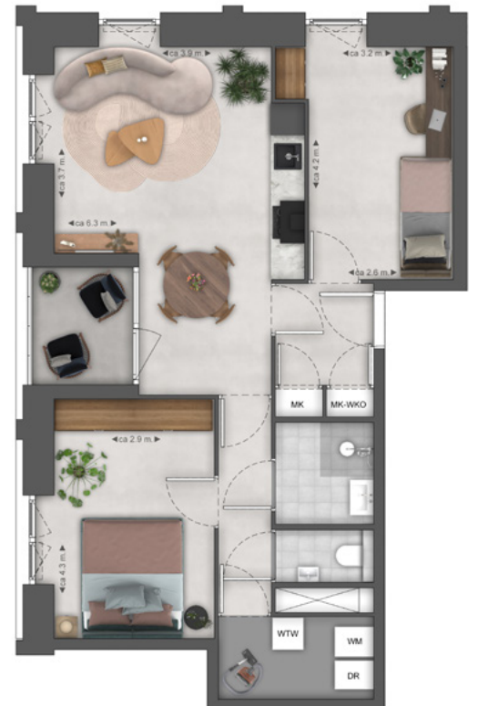
APPARTEMENT TYPE B3